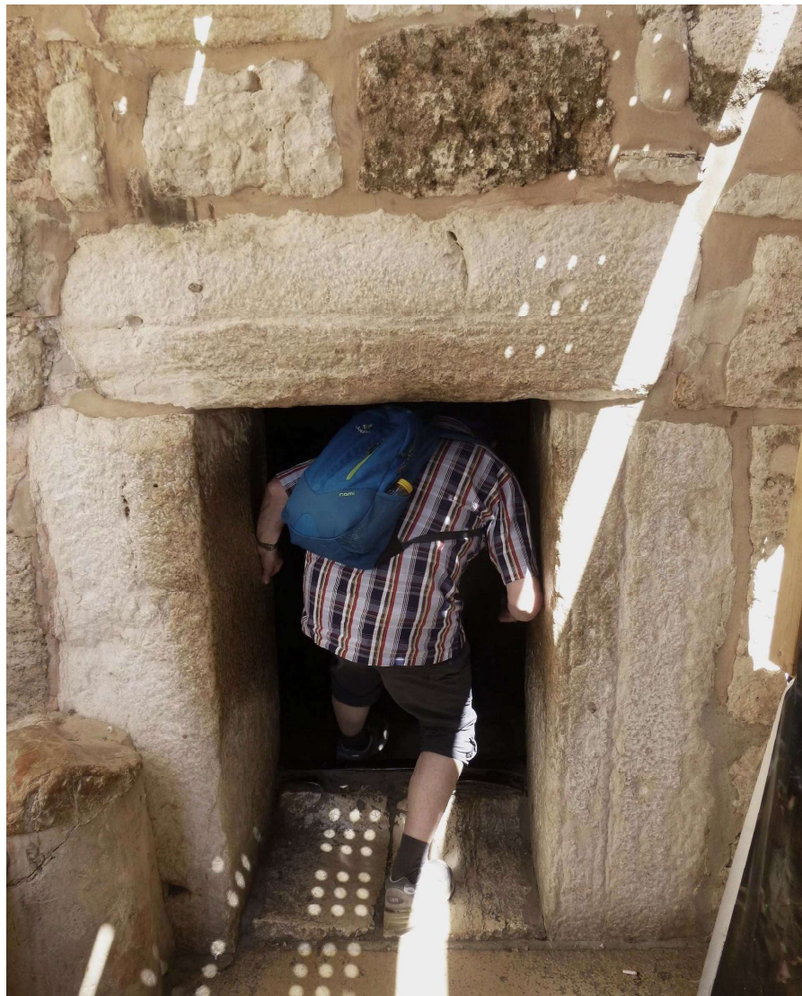
(Haupteingang zur Geburtskirche in Bethlehem, Foto: JEN)

Evangelisch-methodistische Kirche Bezirke Ellefeld & Falkenstein Gemeinden Ellefeld, Falkenstein & Werda