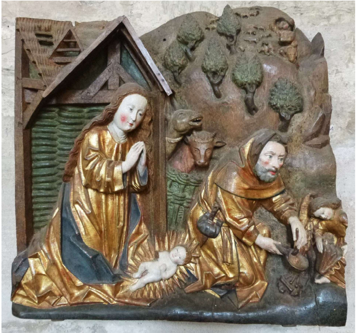
Relief zur Christgeburt im Dom zu Erfurt, Foto: JEN

Evangelisch-methodistische Kirche Bezirke Ellefeld & Falkenstein Gemeinden Ellefeld, Falkenstein & Werda