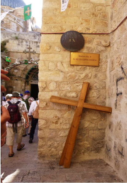
(Kreuzweg Grabeskirche Jerusalem)